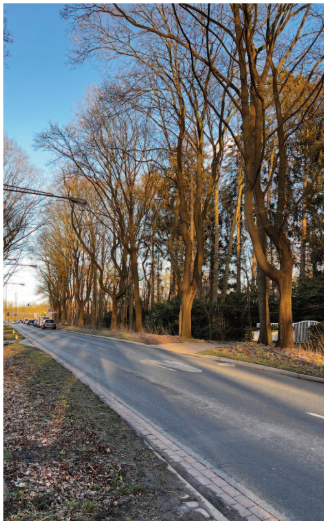
CA. 15 BÄUME FRANZ-SCHÜTTE-ALLEE (2)