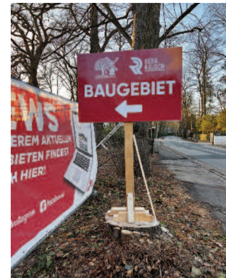
BAUSCHILD AN DER ROCKWINKELER LANDSTR.