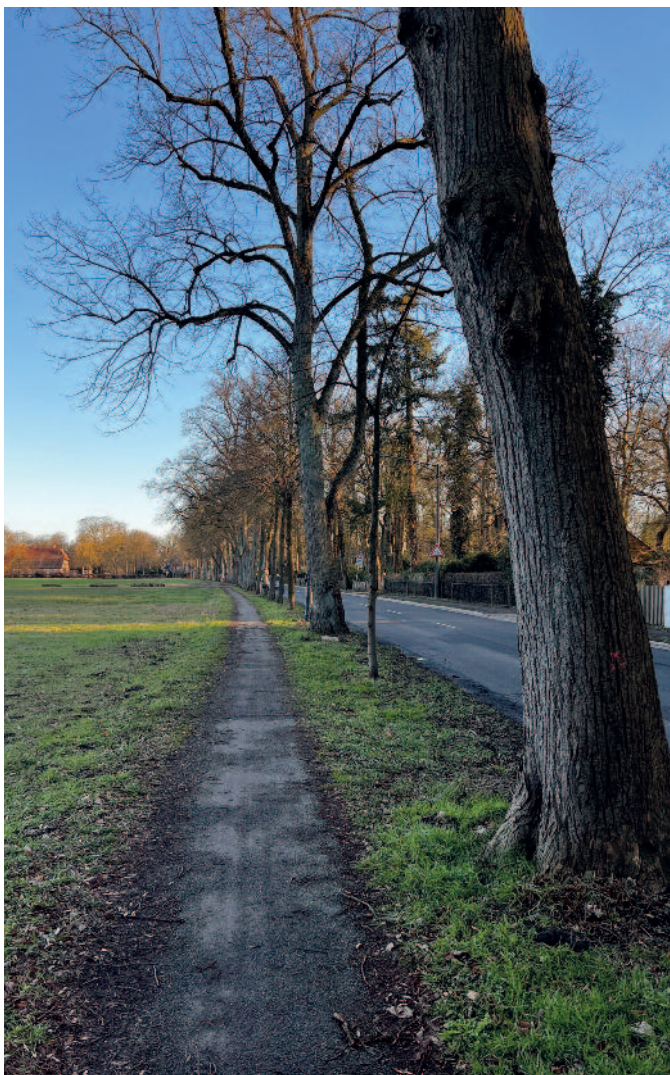
CA. 20 BÄUME DIREKT AM FELD (1)