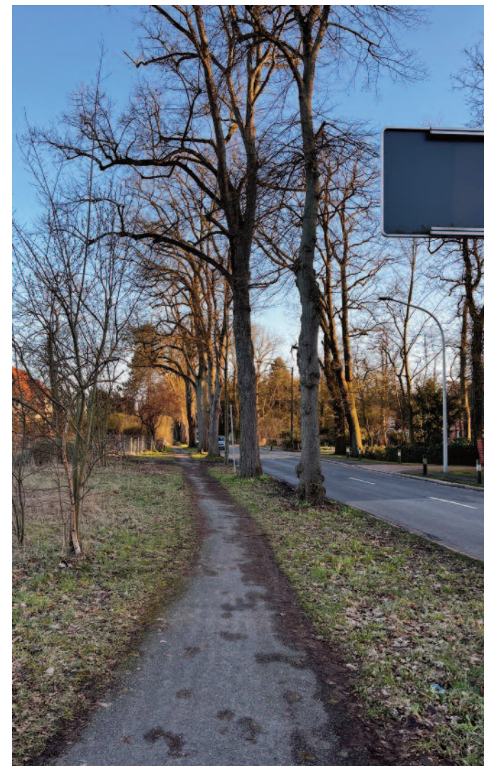
CA. 10 BÄUME ABbieGESPUR TUNNEL (3)